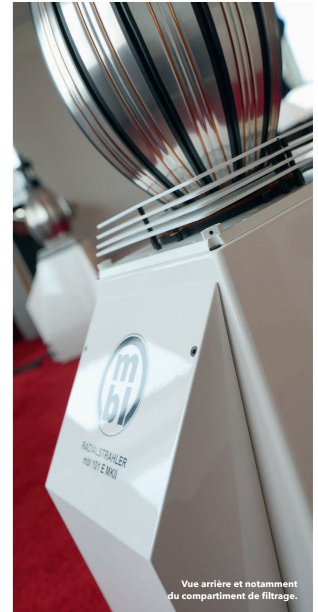
Vue arrière et notamment du compartiment de filtrage.

La partie la plus délicate du filtrage du sous-grave a été d'ajuster la vitesse et le temps de propagation de groupe du woofer à celui du melon de basse supérieur, car les deux doivent travailler ensemble main dans la main et doivent sonner comme une basse unique, et non pas comme une basse et un caisson de basses. Pour un passe-bande, la seule façon de le faire est de changer le compartiment complet (et pas seulement cer-