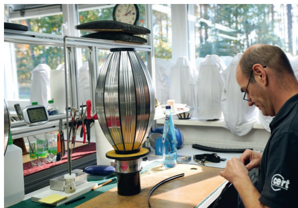
Légende à faire.