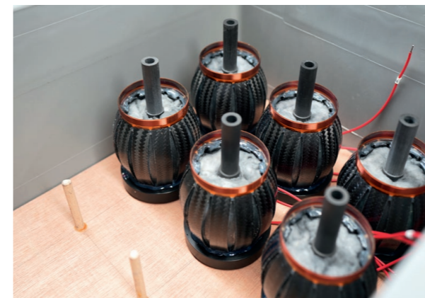
Les transducteurs d'aigu.

Malgré les années qui passent, malgré les milliers d'heures d'écoute parfois frustrantes, souvent passionnantes, parfois miraculeuses, nous sommes encore enthousiastes comme au premier jour. La raison en est très simple, il nous est impossible de