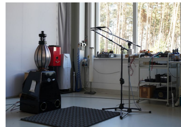
Légende à faire.