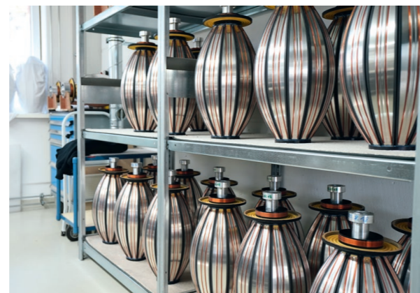
Légende à faire.