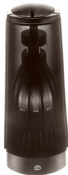
1986 : MBL 101.