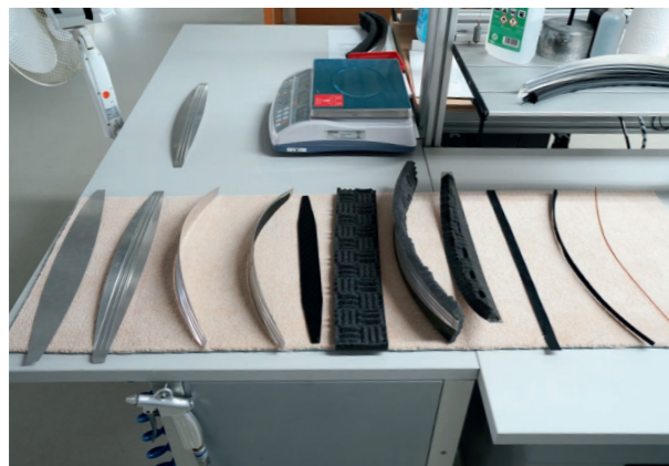
Toutes les parties constitutives du « melon ».

Valhalla 2. Dans son très bel article, Michael Fremer évoque un mariage réussi avec les Tara Labs Omega Gold. Pour parvenir à l'équilibre qui vous convient le mieux, des essais seront indiscutablement à prévoir. À ce niveau de performance, chaque changement est crucial.