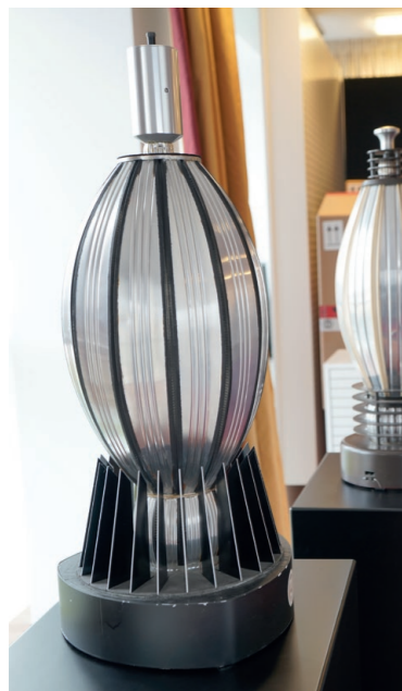
1979 : MBL 100.