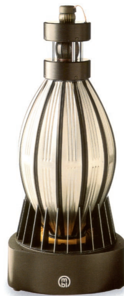
1989 : MBL 101 A.