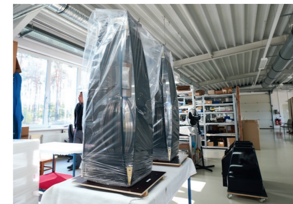
Légende à faire.

cela pousse partout de la même manière, comme une gigantesque source sonore. Les 101 E mkII conservent en permanence un équilibre remarquable que rien ne semble pouvoir entamer. Sur les voix, les instruments à vent, la transparence est d'autant plus agréable qu'elle se manifeste avec une finesse inhabituelle. L'étendue du spectre se poursuit jusqu'à de très hautes fréquences qui, sans être exagérées, donnent aux sons une luminosité exquise et incroyablement naturelle.