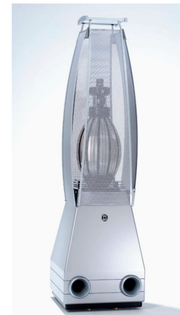
2003 : MBL 101 E.

mobiles et un vrai filtre à trois voies afin de pouvoir supprimer l'égaliseur externe. Après deux ans de développement, la MBL 101 a vu le jour en 1986 comme une authentique enceinte haute résolution au son extrêmement homogène avec un rayonnement sonore aussi naturel que possible.