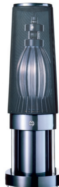
1992 : MBL 101 B + C.