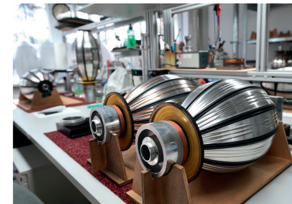
Le « melon » en assemblage final.

Avec les 101 E mkII, vous ressentirez en tout premier lieu une prodigieuse sensation d'énergie qui s'exprime grâce à l'ampleur de basses larges et profondes. La largeur de la bande passante est majestueuse. Ces basses sont aussi d'une qualité dynamique époustouflante. Non seulement les impacts sont reproduits avec puissance, mais