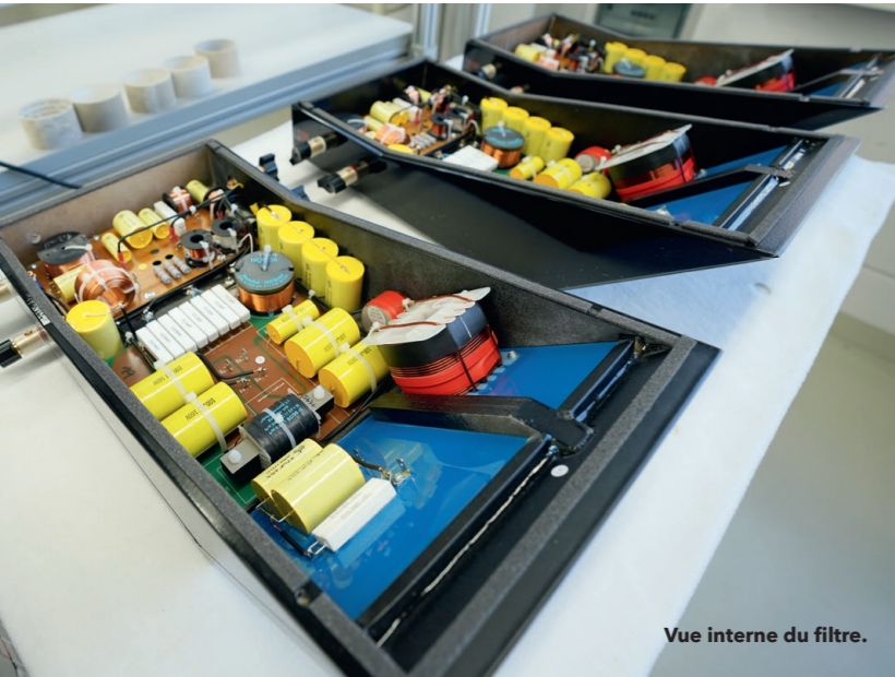
Vue interne du filtre.

taines parties du filtre). C'était donc un peu délicat et cela a nécessité beaucoup d'études de coffrets différents, mais nous avons finalement réussi et le subwoofer est totalement intégré au niveau sonore avec le melon de basse.