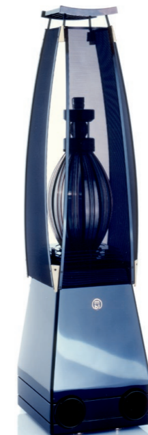
1997 : MBL 101 D.