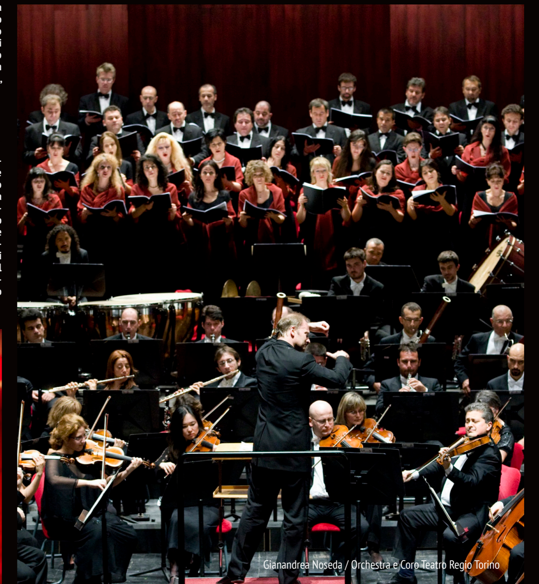
Gianandrea Noseda / Orchestra e Coro Teatro Regio Torino