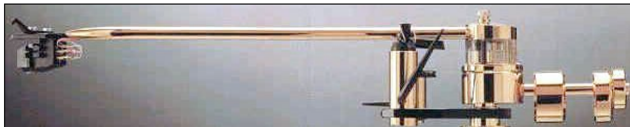
DP-6 de 9'' plaqué or en version Precision

Finition : chromé ou plaqué or 24 carats ou noire