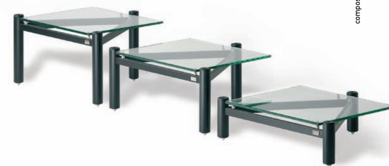
composizione di tre ripiani modulari ISOshelf setting of three ISOshelf shelves